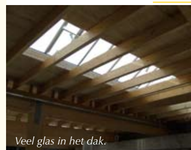
Veel glas in het dak.