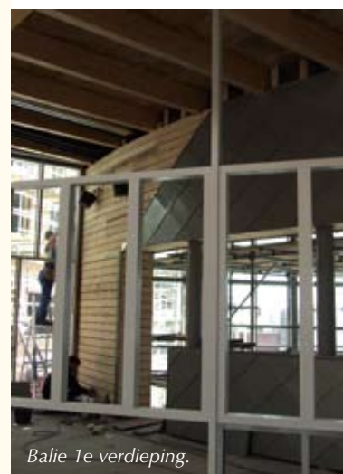
Balie 1e verdieping.