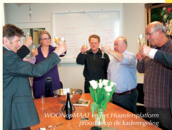
WOONopMAAT en het Huurdersplatform proosten op de kaderregeling

Donderdag 31 maart 2011 was een belangrijke dag voor WOONopMAAT en het Huurdersplatform. Na overeenstemming is de kaderregeling ondertekend. Hierin zijn algemene afspraken vastgelegd voor bewoners die door herstructurering moeten verhuizen. De kaderregeling is met terugwerkende kracht van toepassing op het project Torenflat. De bewoners die al zijn verhuisd, zijn hierover schriftelijk geïnformeerd. De belangrijkste wijzigingen voor het sociaal plan voor de Torenflat zijn: