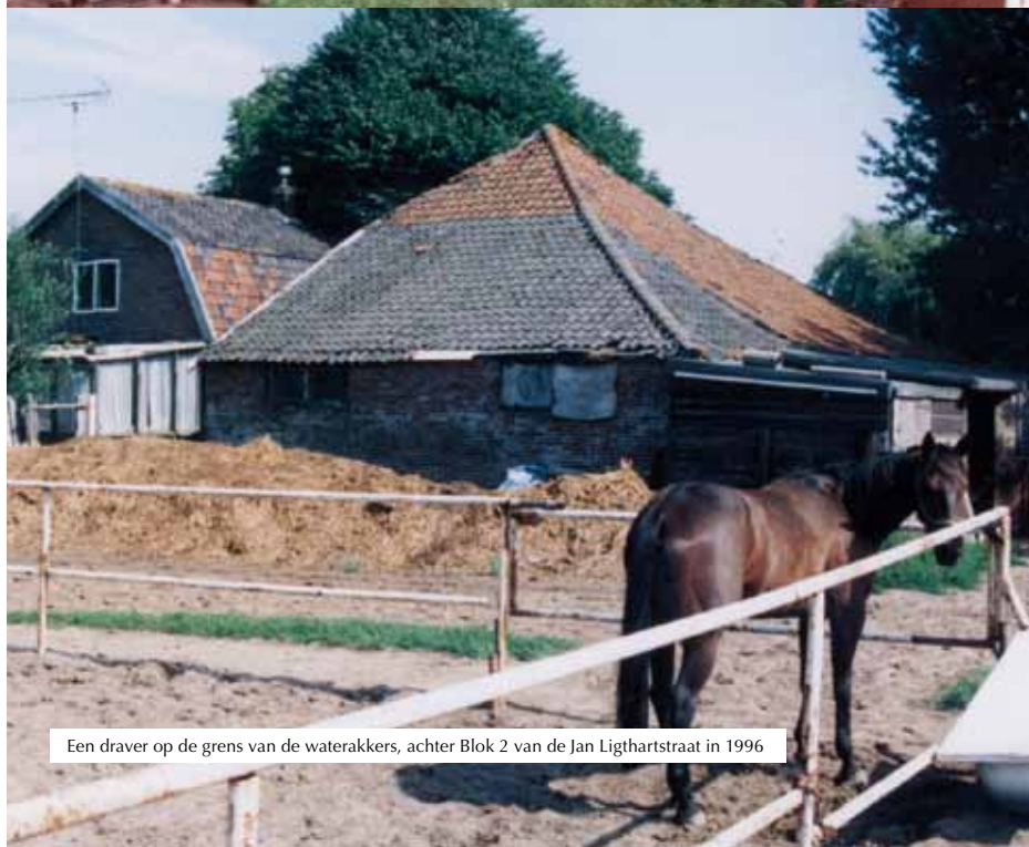
Een draver op de grens van de waterakkers, achter Blok 2 van de Jan Ligthartstraat in 1996

De grens tussen de woonwijken Waterakkers en Commandeurs is de Starweg. De naam is afkom-