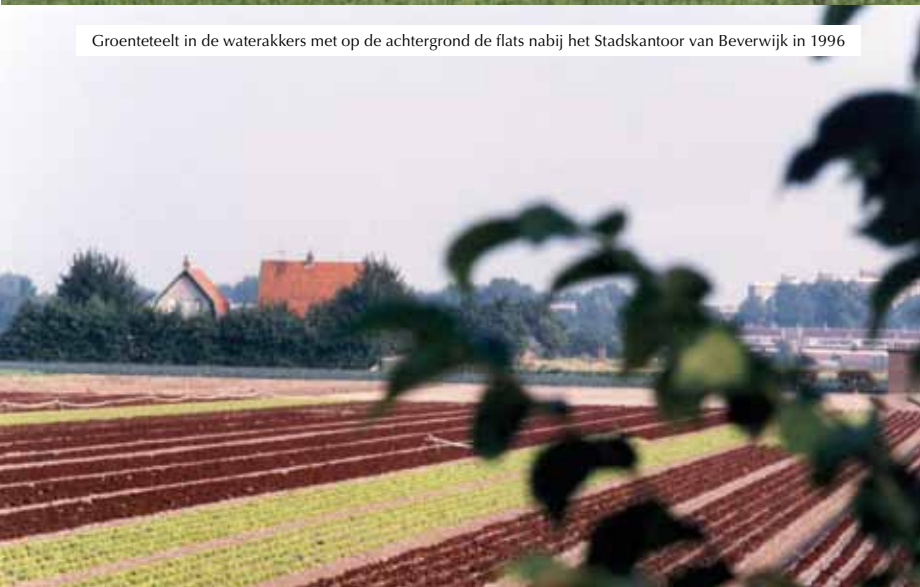
Groenteteelt in de waterkokers met op de achtergrond de flats nabij het Stadskantoor van Beverwijk in 1996

stig van herberg De Vergulde Star die tot in de negentiende eeuw in het centrum van Heemskerk heeft gestaan. Daar was een klein straatje naar genoemd. De Starstraat. Toen die verdween, kwam de naam in de waterkokers terug. Vanaf de plek waar ik woonde, heb ik dertig jaar uitgekeken over het tuindersgebied dat niet meer als zodanig is te herkennen. Er wordt nog altijd aan de wijk gebouwd, maar het restant aan bouwterreintjes ligt al sinds het begin van deze eeuw braak. Vanuit mijn geboortehuis kon ik vroeger alle kanten op kijken. Uitgeest was te zien, Zaandam, Beverwijk en over de waterkokers zag ik, net boven de windsingels, de duinen met het torentje van de Kruisberg. De tuinders hiel-