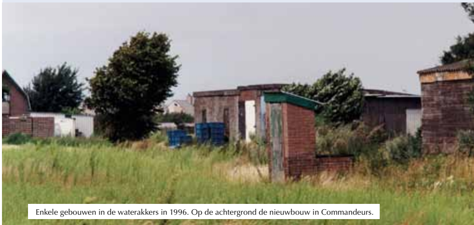
Enkele gebouwen in de waterakkers in 1996. Op de achtergrond de nieuwbouw in Commandeurs.