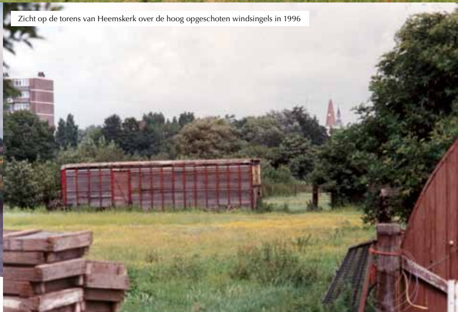
Zicht op de torens van Heemskerk over de hoog opgeschoten windsingels in 1996