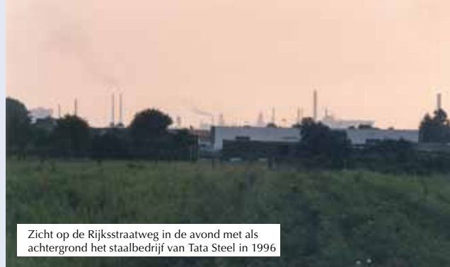
Zicht op de Rijksstraatweg in de avond met als achtergrond het staalbedrijf van Tata Steel in 1996

den hun windsingels laag. Deze waren bedoeld om bij droge winden het zand van de tuinen vast te houden. In Waterkokers is nog één singel als een soort monument bewaard gebleven. Jammer dat het uitzicht vanuit mijn geboortehuis nu is beperkt door garagedeuren, in relatief hoge woningen op twaalf meter afstand. Dat had ruimer gekund, ben ik van mening. De rest van Waterkokers is wel ruim opgezet. Dat mag ook best voor een gebied dat, met uitzondering van een paar huizen, nooit eerder bebouwd is geweest. Kort voordat het gebied bouwrijp werd gemaakt, kreeg de natuur vat op de akkers. Dat leverde mooie plaatjes op. Mogelijk als eerbetoon aan alle akkers die de moeite van het bewerken waard waren.