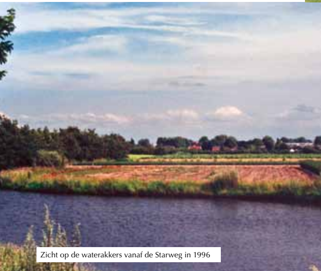
Zicht op de waterakkers vanaf de Starweg in 1996