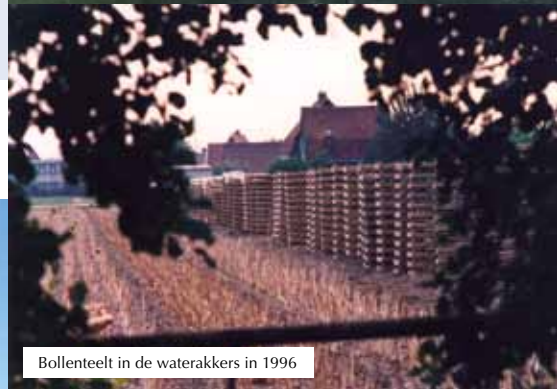
Bollenteelt in de waterkokers in 1996