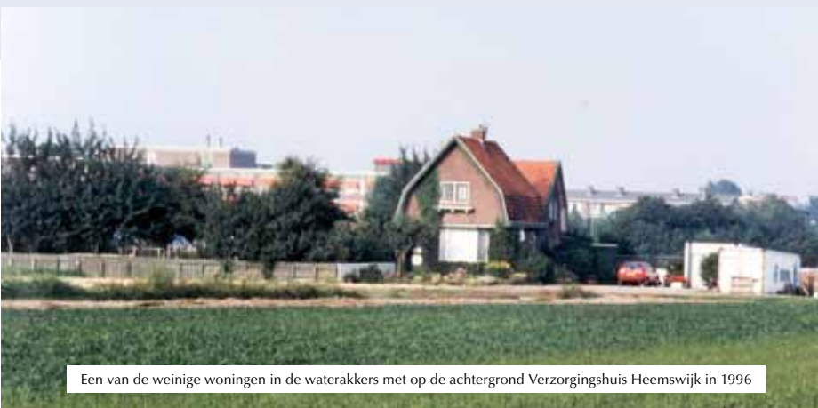
Een van de weinige woningen in de waterkokers met op de achtergrond Verzorgingshuis Heemswijk in 1996