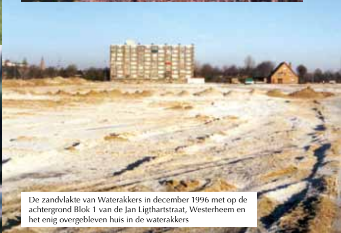
De zandvlakte van Waterkokers in december 1996 met op de achtergrond Blok 1 van de Jan Ligthartstraat, Westerheem en het enig overgebleven huis in de waterkokers