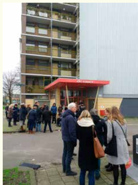
Samen op pad door Oosterwijk. Ook langs het bezit van beide corporaties.

VEEL OUDERE MENSEN VOELEN ZICH EENZAAM, ONVEILIG, ERGEREN ZICH AAN ZWERFAFVAL EN DEALERS.