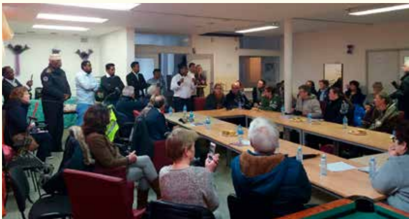
Tijdens een rondgang door de wijk gingen betrokken organisaties op de koffie bij de Somalische gemeenschap.

hun best doen om Oosterwijk prettig en veilig te maken en het cynisme weg te nemen. De gemeenten kiezen voor een integrale aanpak. Daar zijn we erg enthousiast over. Want bouwen is één ding, een prettige wijk is minstens zo belangrijk. Door samen te werken met de bewoners, kunnen we heel ver komen."