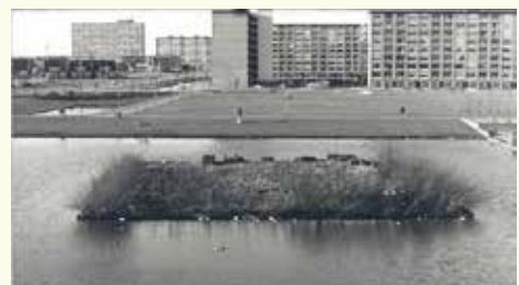
Blik op Oosterwijk rond 1960.