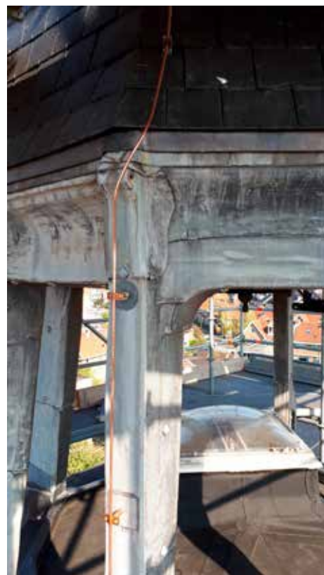
Bliksemafleider bij de Kweekschool aan de Baanstraat in Beverwijk

Je ziet het: hoewel je bij een onweersbui binnen veiliger bent dan buiten, kan er toch nog het een en ander mis gaan. Maar wie deze maatregelen treft, heeft weinig te vrezen.