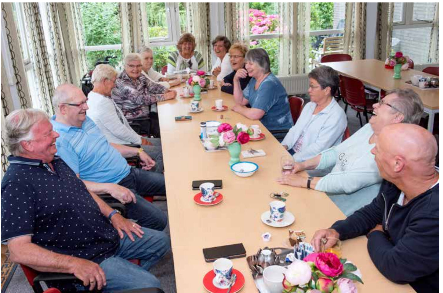
“Iedere dinsdag drinken we koffie.”