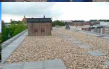
Nieuwe dakbedekking Rond de Wijkertoren