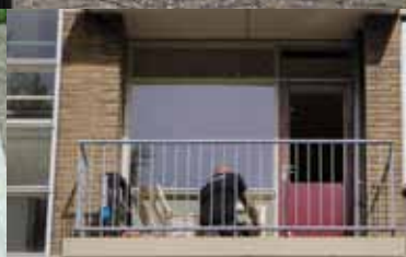
WOONopMAAT vervangt enkel glas