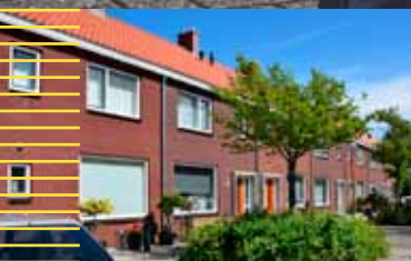
Muziekbuurtt wordt moderne wijk