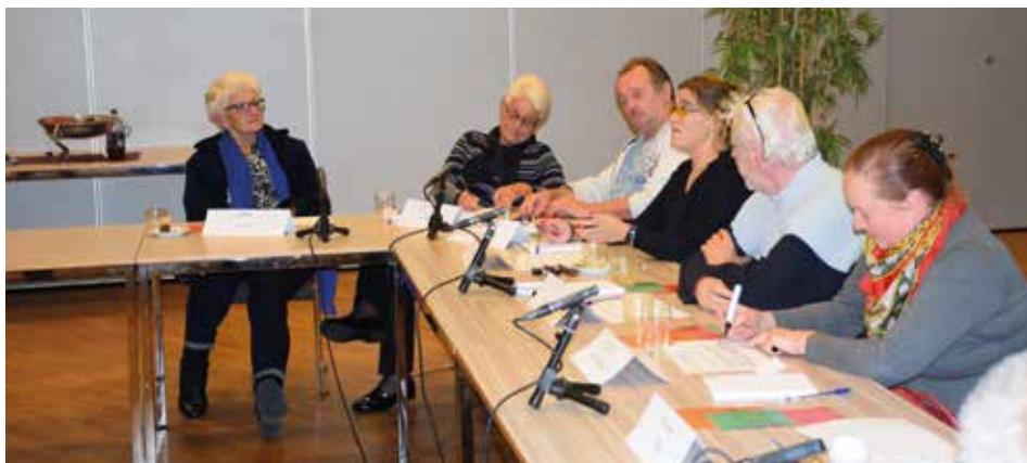
Bewoners bespreken de kwaliteit van de dienstverlening van Woonopmaat tijdens het luisterpanel (foto boven).

"Hopelijk dragen wij als bewoners ons steentje bij aan de realisatie van het project. Woonopmaat heeft in ieder geval aangegeven blij te zijn met de inbreng van de klankbordgroep."