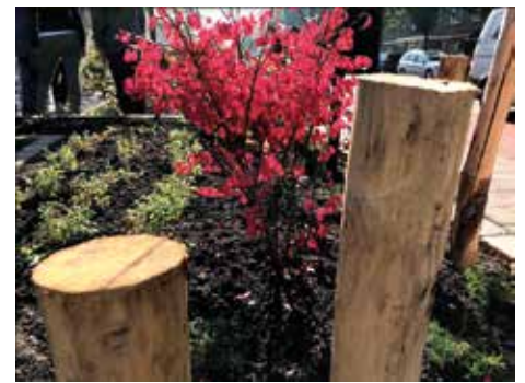
Een impressie van de watervriendelijke tuin na de make-over.