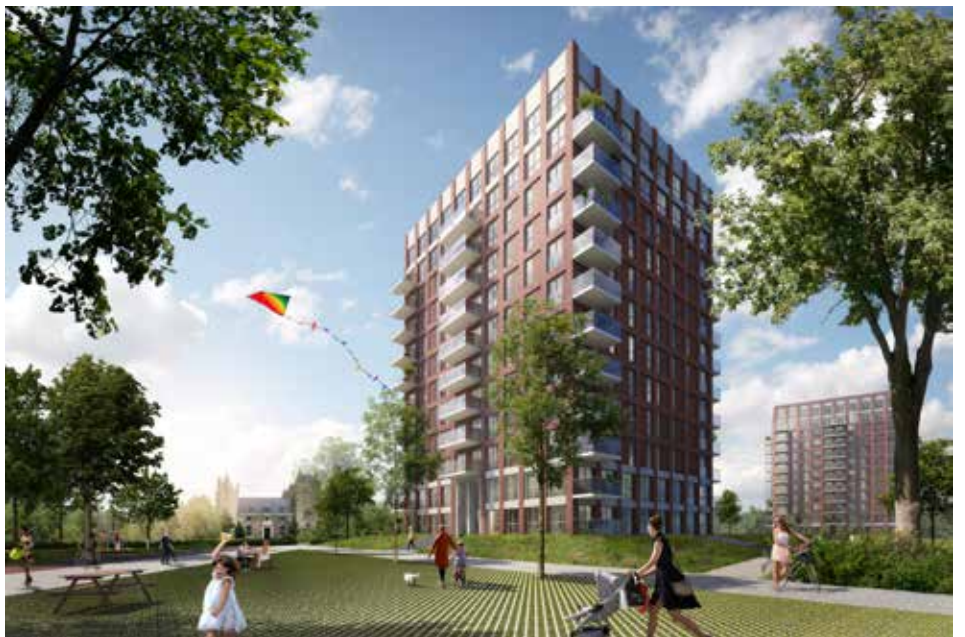
Artist impression van architect Groosman na genoemde aanpassingen.

Na de definitieve afronding van het architectonisch ontwerp worden de verhuurtekeningen gemaakt en worden terugkerende en (later) de nieuwe bewoners verder ingelicht over hun nieuwe woning. Belanghebbenden worden hierover geïnformeerd door Woonopmaat.