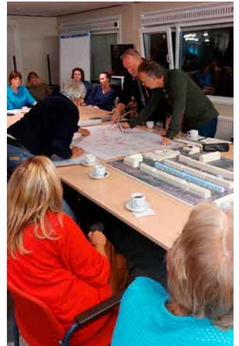
Bewoners denken volop mee over nieuwbouw aan de Elink Sterkstraat

Een onafhankelijke stedenbouwkundige zet de waardevolle eigenschappen van de wijk op een rijtje, en inventariseert de verbeterpunten. Daarna zet de aannemer de eisen op papier, waarna het schetsen kan beginnen. Wat het project extra uitdagend maakt, is het plan om méér woningen te bouwen dan te slopen. Voor de 67 te slopen woningen willen we er 82 terug bouwen. Dit vanwege de grote woningschaarste. De klankbordgroep buigt zich al over deze puzzel. Huizenbezitters aan de Berghuisstraat kunnen besluiten om aan te haken bij (een deel van) de renovatie/isolatiwerkzaamheden. Dat geeft straks ook een fraaier beeld in de straat. Meer informatie over De Groene Tuinen is verkrijgbaar op de projectenpagina www.woonopmaat.nl/projecten/de-groene-tuinen of via een e-mail aan bewonersbegeleider@woonopmaat.nl .